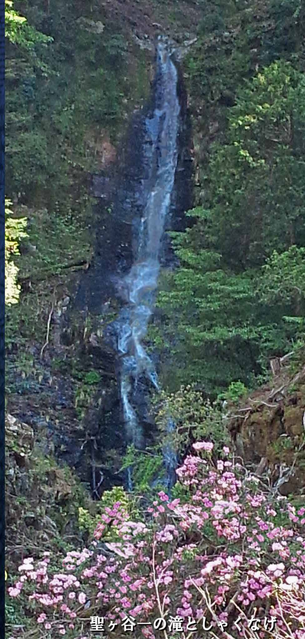
聖ヶ谷一の滝としゃくなげ